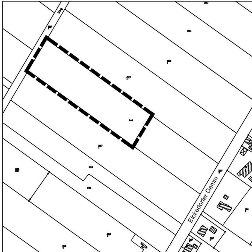
Lageplan externe Kompensation in der Gemeinde Lilienthal (Teilfläche des Flurstückes 246, Flur 1, Gemarkung Heidberg)

Gemäß § 3 Abs. 2 Satz 1 des Baugesetzbuches (BauGB) gebe ich bekannt, dass der Entwurf des o.g. Bebauungsplanes mit Begründung in der Zeit vom